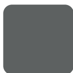
Gris 80 Grey 80