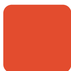
Naranja 20 Orange 20