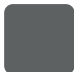
Gris 80 Grey 80