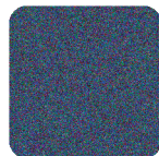
Azulina 50 Royal Blue 50